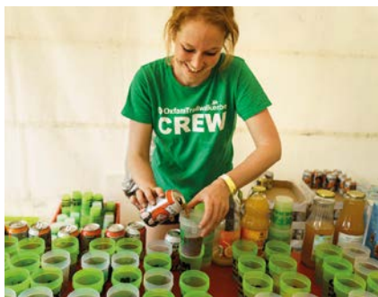
BEVOORRAAD DE TEAMS

Doe mee aan een avontuur dat levens verandert