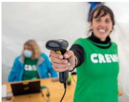
REGISTREER DE DEELNEMERS