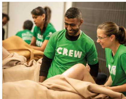
EN VEEL MEER ACTIVITEITEN!