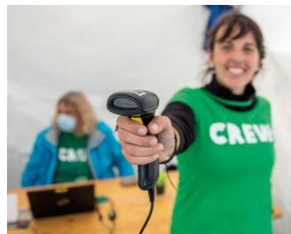
REGISTREER DE DEELNEMERS