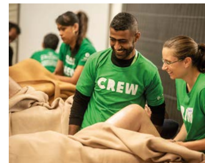
EN VEEL MEER ACTIVITEITEN!