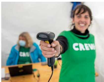
REGISTREER DE DEELNEMERS