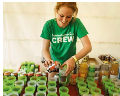
BEVOORRAAD DE TEAMS

NEEM DEEL AAN DIT UITZONDERLIJK EN SUPER SOCIAAL AVONTUUR.